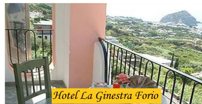
Hotel La Ginestra Forio