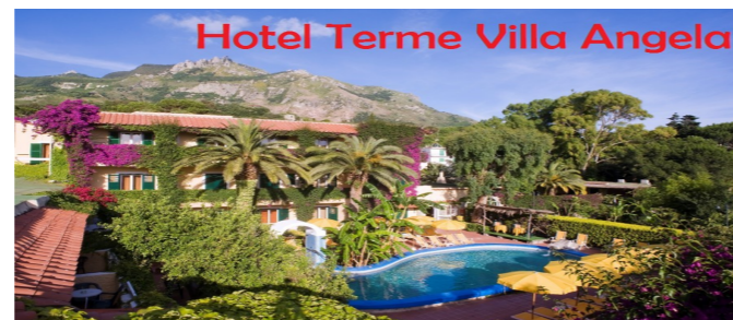
Hotel Terme Villa Angela