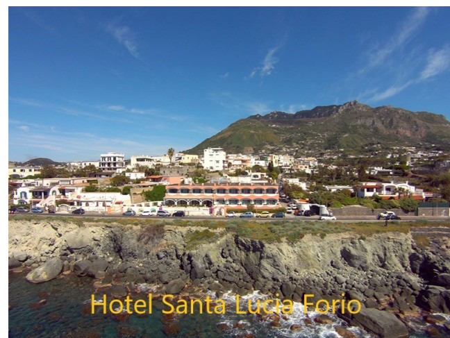
Hotel Santa Lucia Forio