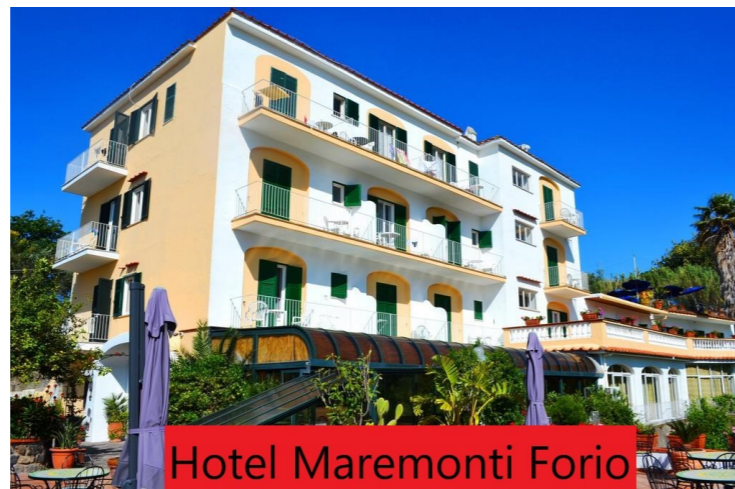
Hotel Maremonti Forio