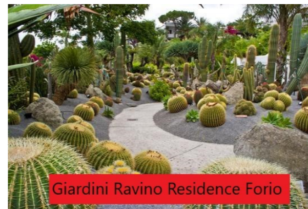
Giardini Ravino Residence Forio