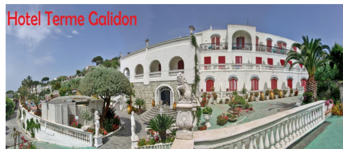
Hotel Terme Galidon