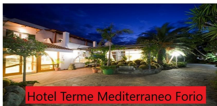
Hotel Terme Mediterraneo Forio