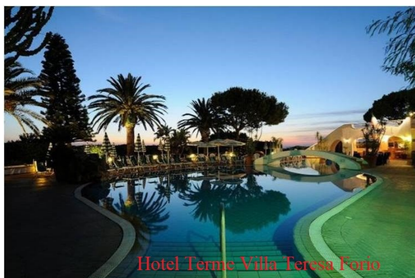
Hotel Terme Villa Teresa Forio

Tutti i partecipanti possono prenotare, entro il 15/9/2018 , la propria vacanza a prezzi scontati negli Hotel convenzionati: Hotel Terme Galidon, Hotel Terme Villa Angela, Hotel Terme Mediterraneo Gruppo CAST Hotel Terme, Hotel Maremonti, Hotel La Ginestra, Hotel La Rondinella, Residence Villa Ravino, Park Hotel Victoria, Hotel Terme Villa Teresa, Hotel Santa Lucia, Hotel Casa Cigliano, Hotel Al Bosco.